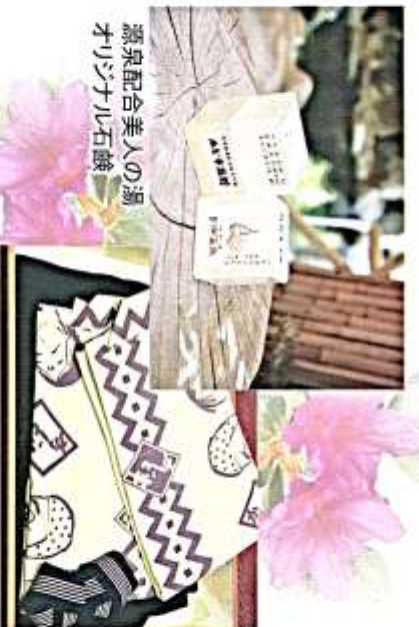
美人の湯 オリジナル石鹸

河原の岩間からくぐり湧泉 は三十五度。 そのため薬湯と何畔にある 露天風呂の奥の浴槽 が源泉のままのほかは、多 少加温していますが循環 せず、掛け流しです。